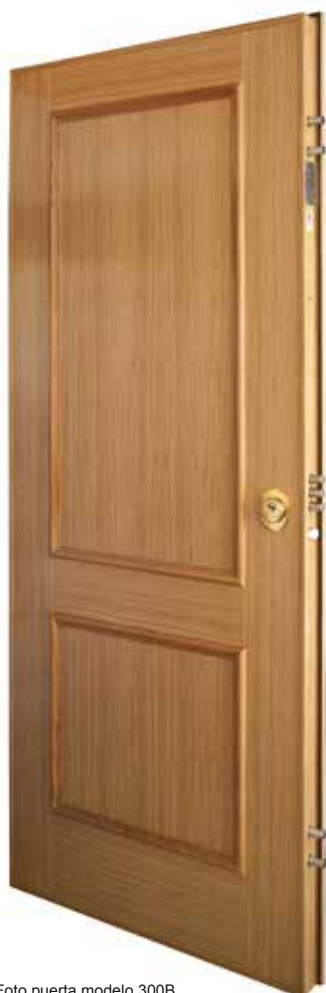
Foto puerta modelo 300B