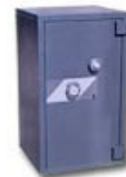
HS4 ranura 275