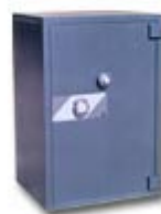
HS4 ranura 150