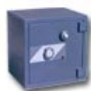
HS4 ranura 80